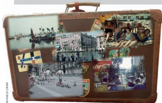
ERINNERUNGEN | Ein Koffer, wie ihn in den 1960er Jahren so gut wie jede Familie besaß – verquickt mit Postkarten aus einem Italienurlaub.